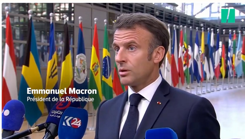
Fiona Scott Morton à Bruxelles : Emmanuel Macron se dit « dubitatif » au sujet de cette nomination

Avant l'audition, Emmanuel Macron, Président de la République française, s'était déjà déclaré " sceptique " face